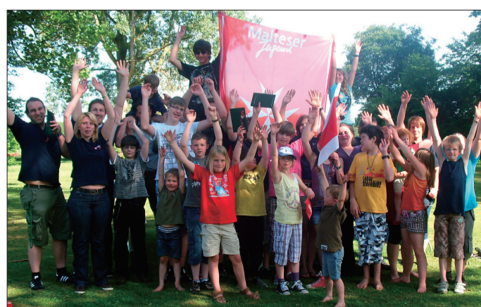
Spurensucher: Die Jugendlichen reisten quer durch das Bistum, um geschichtlich bedeutsame Orte zu besuchen.

Von Süden starteten die Gruppen aus Wallenhorst, Lingen und Alfhausen in Osnabrück. Dort besichtigten sie den Adelshof, der früher zur Adelmehle gehörte, und die Bischöfliche Kanzlei, in deren Keller während des Weihnachtsmarkts der Glühweinverkauf zugunsten von Hilfsprojekten in Russland läuft.