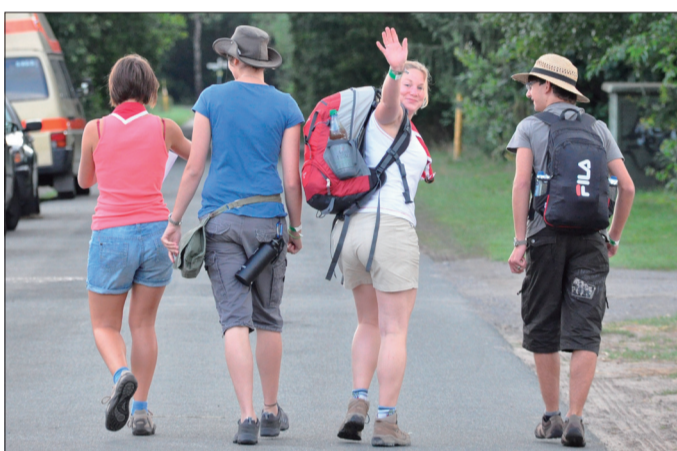
Wir sind dann mal weg: Eine Gruppe wanderte zwei Tage lang auf dem Jakobsweg.

am letzten Handelstag. Auf dem Platz vor der Hansekogge feilschten die Händlergruppen stundenlang um Güter wie Handarbeiten, Brot und Salz.