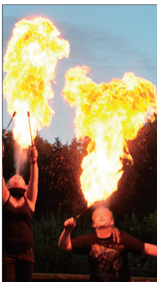
Heiß! Feuerspucker lassen im Malteser-Lager die Flammen lodern.

Zum Hit der gemeinsamen Zeit wurde das Lagerlied „Hökern un praten“. Vom ersten Abend an stimmten Gruppenleiter und -kinder es immer wieder an. So auch beim Hansemarkt