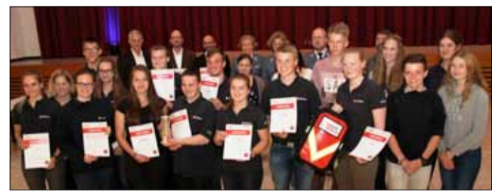
Die Schüler aus Bersenbrück dürfen sich jetzt „Herausragender Schulsanitätsdienst“ nennen.