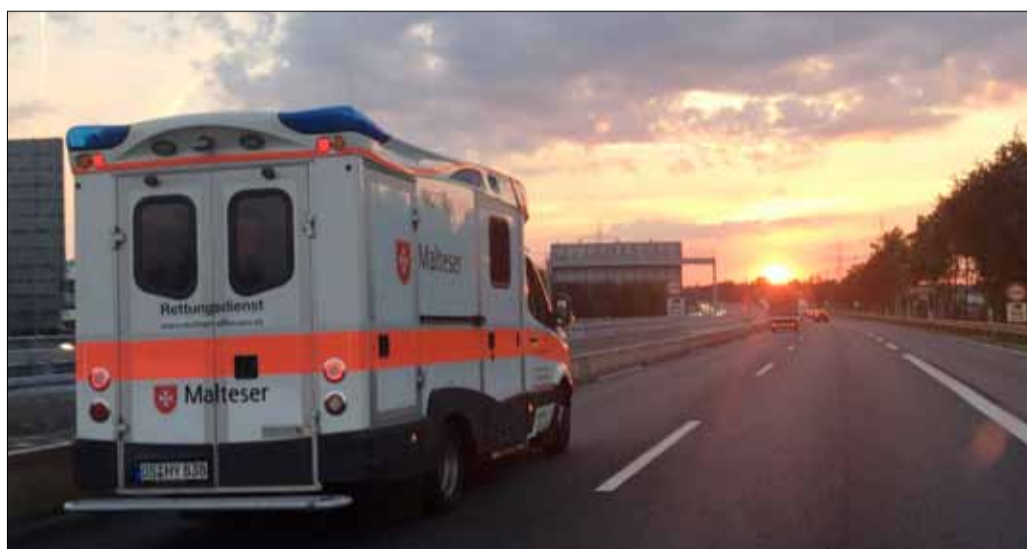
Der „Herzenswunsch-Krankenwagen“ ist in Alfhausen stationiert.

In solchen Fällen soll der dank ehrenamtlichen Personals und Spendengeldern für die Patienten kostenlose „Herzenswunsch-Krankenwagen“ eingesetzt werden. Als Vorbild dienen die „Wish Ambulance“ aus Israel und ein Pilotprojekt der Malteser Leverkusen. „Das Fahrzeug wird jeweils mit einem Rettungssanitäter und Fahrer, bedarfsgerecht auch mit einer examinierten Kraft aus dem Hospiz, Krankenhaus oder Pflegeheim besetzt, so dass sowohl die medizinische als auch die psychosoziale Un-