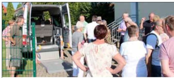
Einweisung der Ehrenamtlichen in Engter

An 13 Standorten im Bistum haben die Malteser seit 2014 ihren „Mobilen Einkaufswagen“, den kostenlosen Einkaufsfahrdienst für nicht mehr mobile Senioren, aufgebaut. Damit stellt der Diözesanverband Osnabrück über die Hälfte aller Angebote in Deutschland. Der zunehmenden Nachfrage entsprechend, wurde jetzt ein neues, an den anderen sozialen Malteserdiensten orientiertes Logo